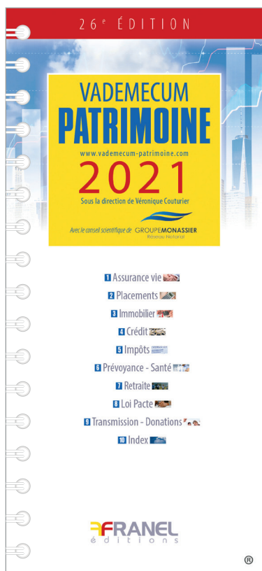
Version Papier 180 pages, mises à jour sur site